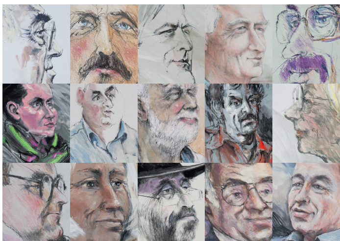
Collage der in der Ausstellung gezeigten Uni-Köpfe (Grafik: Hille Schulte)

Hinzu kamen ausgefeilte Symboliken und Beziehungsaussagen, die über das im Bildraum platzierte Interieur transportiert wurden. Das waren beispielsweise für eine Disziplin oder neue wissenschaftliche Entwicklungen stehende Werkzeuge und Arbeitsgeräte. Vielfach standen in den Buchregalen die Werke der abgebildeten Personen oder die ihrer akademischen Lehrer. Über künstlerische Raffinesse ließ sich aber auch aufzeigen, mit wessen wissenschaftlicher Expertise man nicht in Verbindung gebracht werden wollte. Interieur eignete sich ebenso dazu, um weltanschauliche Beziehungsaussagen aller Art zu machen. Der Porträtierte platzierte sich und sein Œuvre in diesen Gemälden somit sowohl im fachlich-wissenschaftlichen als auch im politischen, gesellschaftlichen und kulturellen Diskurs seiner Zeit.