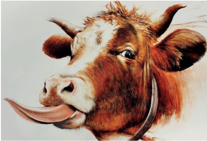
Kuh „Rosi“ (Klaus Beilstein, 2009)

wählen, sie wichtig zu nehmen, sie zum Subjekt umzuformen, ist auch nicht einfach. Nach Klaus Beilsteins Bildern kann niemand mehr „dumme Kuh“ sagen, wenn es vorher noch stattgefunden hätte.